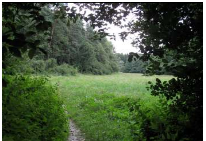
Takováto krásná přírodní zákoutí Milíčovského lesa a údolí Botiče, sloužící lidem k oddechu, by komunikace JVK zničila.