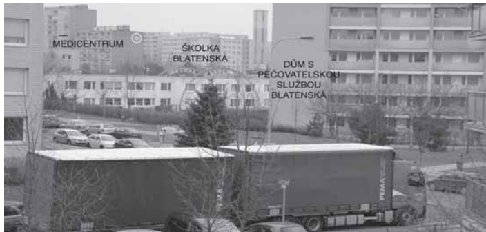
Kamión v ul. Kloknerova, Chodov, jaro 2013

Sídlištní ulic Kloknerova na Roztylech běžně jezdí kamióny a těžká doprava . Posledních pár let se z klidné úzké ulice stala průmyslová spojka. Kamióny a nákladní vozidla jezdí bezprostředně kolem dvou mateřských školek a domu s pečovatelskou službou, ani se do ulice nevejdou. Mají povolení vjezdu, když máme na JM zákaz 12t? Pokud ano, vidělo někdy situaci v Kloknerově oddělení dopravy nebo silniční správní úřad MČ Praha 11? Více než dva roky žádají místní obyvatelé o zklidnění ul. Kloknerova, dožádali se alespoň zpomalovacích prahů a značek omezení rychlosti. Nevhodný tvar prahů způsobuje při přejezdu větších vozidel ohlušující rány. Na přechod pro chodce u školky Babákova prý nejsou peníze.