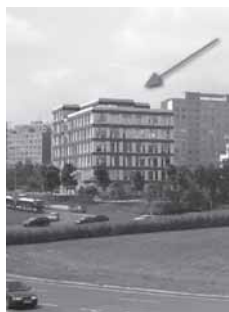
Vizualizace „Administrativní budova U Kunratického lesa“

(DOUFÁME, ŽE SE JIMI KOALICE POCHLUBÍ V KLÍČI):