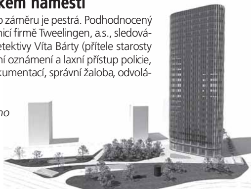
Vizualizace výškového domu na pozemku současného parku a pietního místa na Litochlebském náměstí, Praha 11