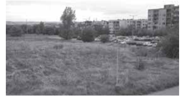
Louka a parkoviště ul. Blatenská určeny k zástavbě bytovými domy Na Výhledu, Horní Roztyly, srpen 2013

Zelená plocha mezi ulicemi Ryšavého – Hrdličkova – Kaplanova (u Medicentra) na Roztylech nebyla letos do října ani jednou posekána. Firma SELEQUNE, s.r.o., která pozemek koupila v roce 2010 od MČ P11, se tak zřejmě snaží podpořit své vyjádření v Oznámení záměru v EIA, že se jedná o neudržovaný pozemek s nekvalitní zelení . O.s. Ochrana Roztyl se od svého vzniku v roce 2011 snaží zabránit zrušení parkoviště Hrdličkova – Blatenská, které bylo stejné firmě ve stejnou dobu prodáno také. Snažíme se zabránit stavbě obytných domů vyšších než okolní zástavba na jediném veřejném parkovišti v naší části sídliště a na zmíněné zelené ploše. S detaily kauzy „Na Výhledu“ se seznámte na www.ochranaroztyl.estranky.cz