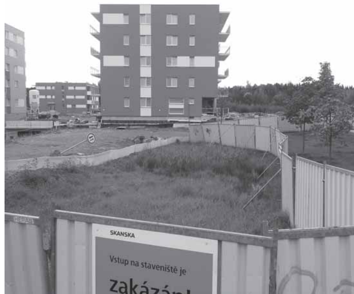
Mokřad s výskytem kriticky ohroženého skokana skřehotavého, Milíčov – Háje, foto z 14.9.2013

Rozsudek NSS potvrdil pravomocné zrušení Výjimky z ochrany kriticky a silně ohrožených živočichů (Výjimka) vydané Ministerstvem životního prostředí (MŽP): „ Pokud by pak snad i existoval naléhavý veřejný zájem na výstavbě bytů, nebylo prokázáno, že jej nelze uspokojit jiným řešením, které by realizovalo požadovaný záměr na výstavbě bytů a současně minimalizovalo případný zásah do zákonné ochrany zvláště chráněných druhů živočichů “. Na základě soudem zrušené Výjimky, bylo zahájeno řízení o obnově stavebního řízení pro „Obytný soubor Milíčovský háj jih a východ“.