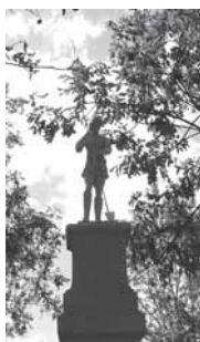
Socha sv. Izidora, Chodov, Praha 11

Bouřka letos v létě 2013 obnovenou sochu poškodila – spadly na ní větve stromu. Je potřeba sochu opravit a vrátit na místo. Prosíme proto občany Jižního Města, příj. i odjinud, o jakoukoliv finanční částku na opravu poškozené sochy (č. účtu 221804264/0300).