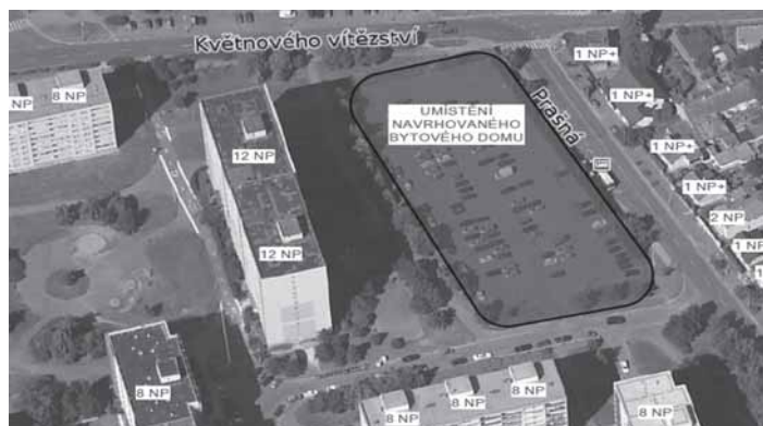
Vizualizace BD Prašná, Studie stavby pro předběžné projednání, investor MČ Praha 11, 7/2012

Nejsme žádní asociálové, jak jsme byli označeni pracovníkem radnice, ale žijeme tak, jak nám naše finanční situace umožňuje. Chceme dál byd-