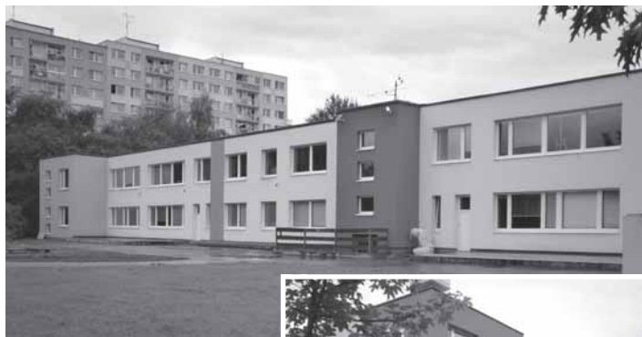
Bývalá školka ul. Stříbrského, září 2013

Rada MČ Praha 11 dne 8.8.2013 schválila záměry prodeje několika objektů bývalých MŠ a jeslí , kde v současnosti působí soukromé školy. Jde o objekty: bývalá MŠ Hrudičkova, bývalá MŠ Stříbrského, bývalá MŠ Machkova, bývalá MŠ Chomutovická.