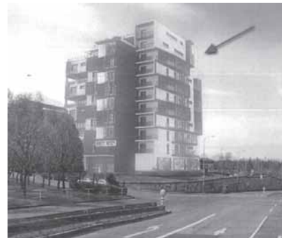
Vizualizace „Bytový dům Gregorova“, pohled z ul. Ryšavého, Horní Roztyly

Developer zastoupený společností CLV Development s.r.o. aktuálně usiluje (od 4/2013) o výstavbu obldného 11-podlažního domu s třemi patry podzemních garáží, a to na místě blokové kotelny v ulici Gregorova (viz obrázky). Pozemek s kotelnou je v současném územním plánu veden jako území stabilizované se zvýšenou ochranou zeleně. Nevkusný architektonický návrh provedla, na JM provařená, firma ATELIER 6 (ing. arch. Libor Čížek).