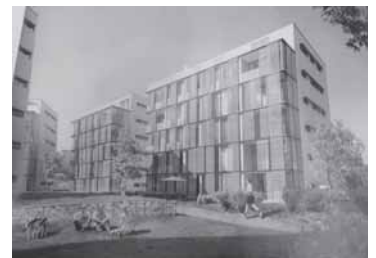
Vizualizace Bytový park Roztyly, ul. Ryšavého, Praha 11