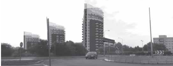
Vizualizace „Tři věže, Obytný soubor Háje“, Dokumentace pro úpravu míry využití území, EIA MŽP 2/2009