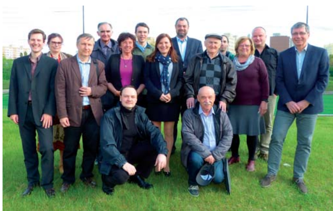
zastupitelé Hnutí pro Prahu 11, květen 2017