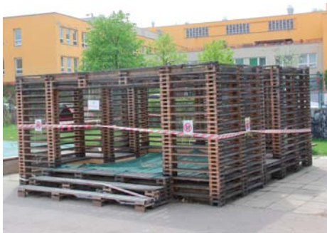
Děti v MŠ Blatenská nemohou už dva roky využívat zastavěné pískoviště, nezákonná a předražená pergola je obehnaná páskou (foto z 27.4.2017).

Možná jste zaregistrovali kauzu „Pergola MŠ Blatenská“, zastínění pískoviště, pár dřevěných palet za neuvěřitelných 250 tisíc Kč. Rodiče žádali prošetření nákupu, bezpečnosti a certifikaci pergoly. Rovněž podali podnět na prošetření dalších nejasných aktivit ve školce. V roce 2015 byla v právním auditu městské části ještě pod vedením HPP 11, zjištěna závažná pochybení paní ředitelky. Ta nakonec rezignovala na svou funkci. Po odvolání HPP 11 z radnice nebyla Rada ANO/TOP schopna (ochotna) šetření dotáhnout a rodičům do dnešního dne říct výsledek. Věcná kauza se změnila v kauzu politickou.