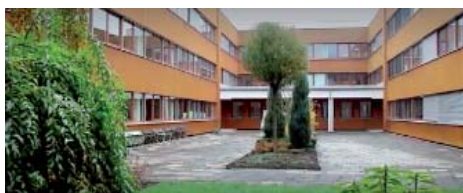
dále jen „Nájemce“

Domnívám se, že člověk, který směšuje zájmy rodinného byznysu se zájmy MČ, nemůže být starostou. Pane Jiravo, odstupte!