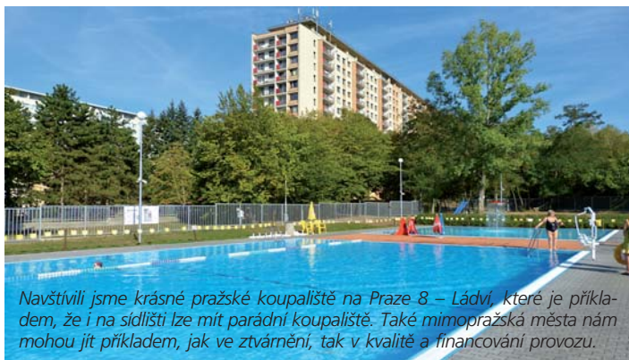
Navštívili jsme krásné pražské koupaliště na Praze 8 – Ládví, které je příkladem, že i na sídlišti lze mít parádní koupaliště. Také mimopražská města nám mohou být příkladem, jak ve ztvárnění, tak v kvalitě a financování provozu.

Konečně bychom chtěli na Praze 11 postavit městské koupaliště. Máme předběžně vytipované tři lokality – hřiště u ZŠ K Miličovu, park u bazénu a území Na Jelenách. Nezatajujeme, že každá z těchto lokalit má své vady, které mohou realizaci zkomplikovat, nikoli však znemožnit.