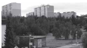
Lesík na Roztylech před prvním plošným vykácením, jaro 2010

O.s. Zelené Roztyly podalo žalobu na územní rozhodnutí a odvolání proti stavebnímu povolení.