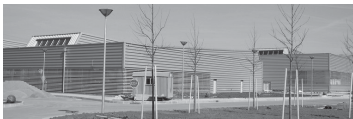
Hangáry předraženého bazénu 11VS, ul. Mírového hnutí, březen 2014

Územní plán hl. m. Prahy je dlouhodobě přizpůsobován velkým stavebním záměrům. Investorům slouží Magistrát hl. m. Prahy, městské samosprávy i státní správa. Věřili jsme, že nástup primátora T. Huďečka a magistrátní TOP 09 r. 2013 přinese změnu k lepšímu. Přestože jsme v letech 2011–13 osobně iniciovali setkání a spolupráci nad kauzami JM, apelovali na zastavení praktik éry primátora Béma, Magistrát funguje i dnes ve starých kolejích. Platný územní plán se bude ohýbat nejméně do roku 2017. Přestože se připravuje tzv. Metropolitní plán, jsou nadále pořizovány změny a úpravy ÚP. Každý kousek zeleně, hřiště, parkoviště lze změnit na stavební pozemek, stačí mít „k ruce“ ty správné úředníky.