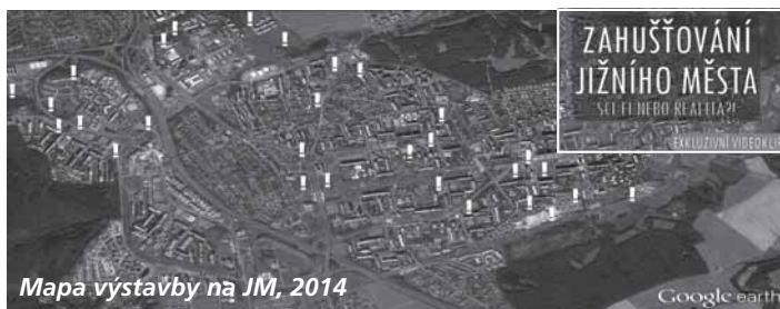
Mapa výstavby na JM, 2014