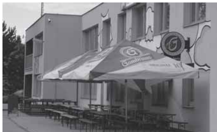
Bývalá školka ul. Hrabákova-Roztyly, hospoda a hlavní kancelář o.p.s. SJM

SJM o.p.s. má hlavní kancelář v areálu bývalé školky