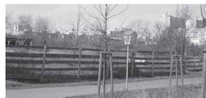
Neexistující Zoopark Miličov, březen 2014