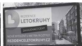
Nepostavené byty se již prodávají, leden 2014

Videodokument „Slza pro Roztyly“ shlédněte na www.hpp11.cz Zajímejte se o své okolí, je to i Váš domov.