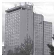
Hotel Sandra, Opatov

Miliarda korun přinese pouhých 420 bytových jednotek. Po letech tunelování a plýtvání je tento „nákup“ poslední ranou pro rozpočet MČ. Navíc prokazatelných min. 300 mil. Kč bylo „investováno“ zbytečně.